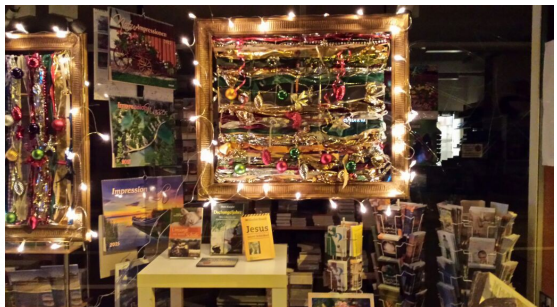
Haus der Bibel Basel - Weihnachtlich dekoriertes Schaufenster