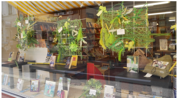
Haus der Bibel Basel - Fröhlich dekoriertes Schaufenster