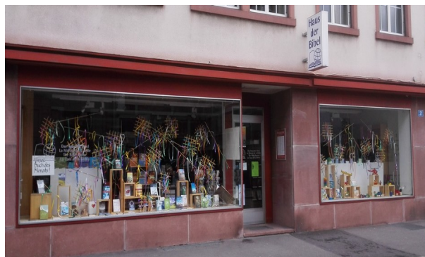
Schaufenster Haus der Bibel – Thema: Frühling

Die Freundlichkeit des Herrn, unseres Gottes, sei über uns und festige über uns das Werk unserer Hände! Ja, das Werk unserer Hände, festige du es! (Ps 90, 17)